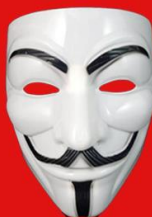
MODEL: BAR OUFH KI