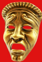
MODEL: EVA GELA TO