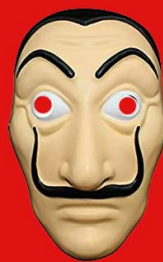
MODEL: TSIP RA