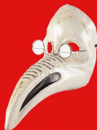
MODEL: TSI O DRA