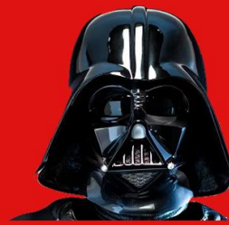
MODEL: HRYSO HO IDH