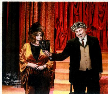
Η ομάδα «Θεατρίλιον» ερχεται από το Ιλιον της Αττικής

5) 9μελής επιτροπή του ΕΣΠ «Ρεφενέ» (1 ψήφος)