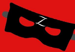
MODEL: KOU TSOU BA