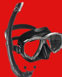
MODEL: DE KATALAVA.GR