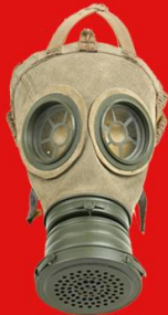
MODEL: P AGONH