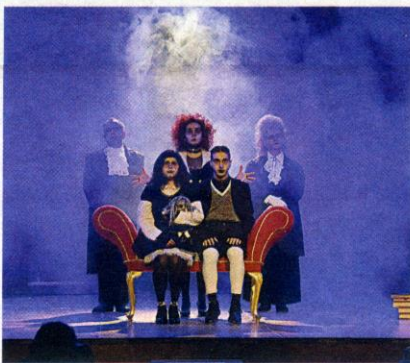
Το Τριφυλιακό Ερασιτεχνικό Θέατρο Φιλατρών