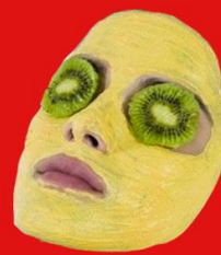
MODEL: FO FI