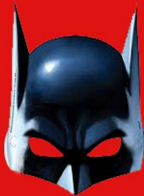
MODEL: KYRIA KO

Πανελλήνιο Φεστιβάλ Σάτιρας Ερασιτεχνικών Θιάσων