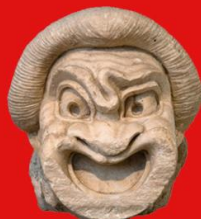
MODEL: VELO POULO