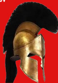
MODEL: HARD ALIA