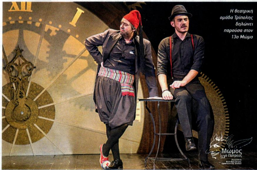
Η θεατρική ομάδα Τρίπολης δηλώνει παρουσία στον 13ο Μώμο