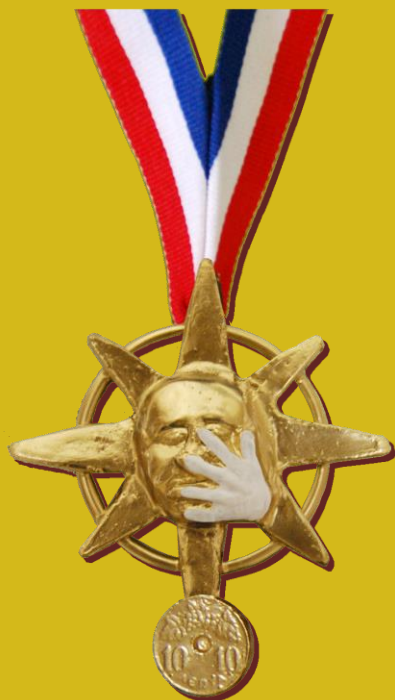
Αναμνηστικό (Παράσημο ανοικτής παλάμης, διαφορετικού χρωματισμού για κάθε Μώμο)/ σχεδιασμός & κατασκευή Ρεφερέ Ε.Σ.Π.